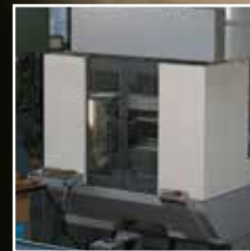
Machine / Outil