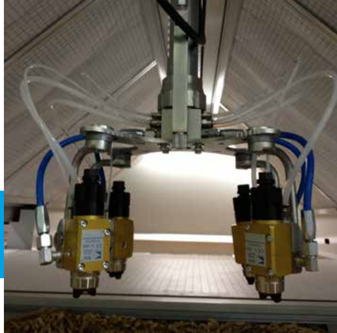
Pistolet AVX automatique