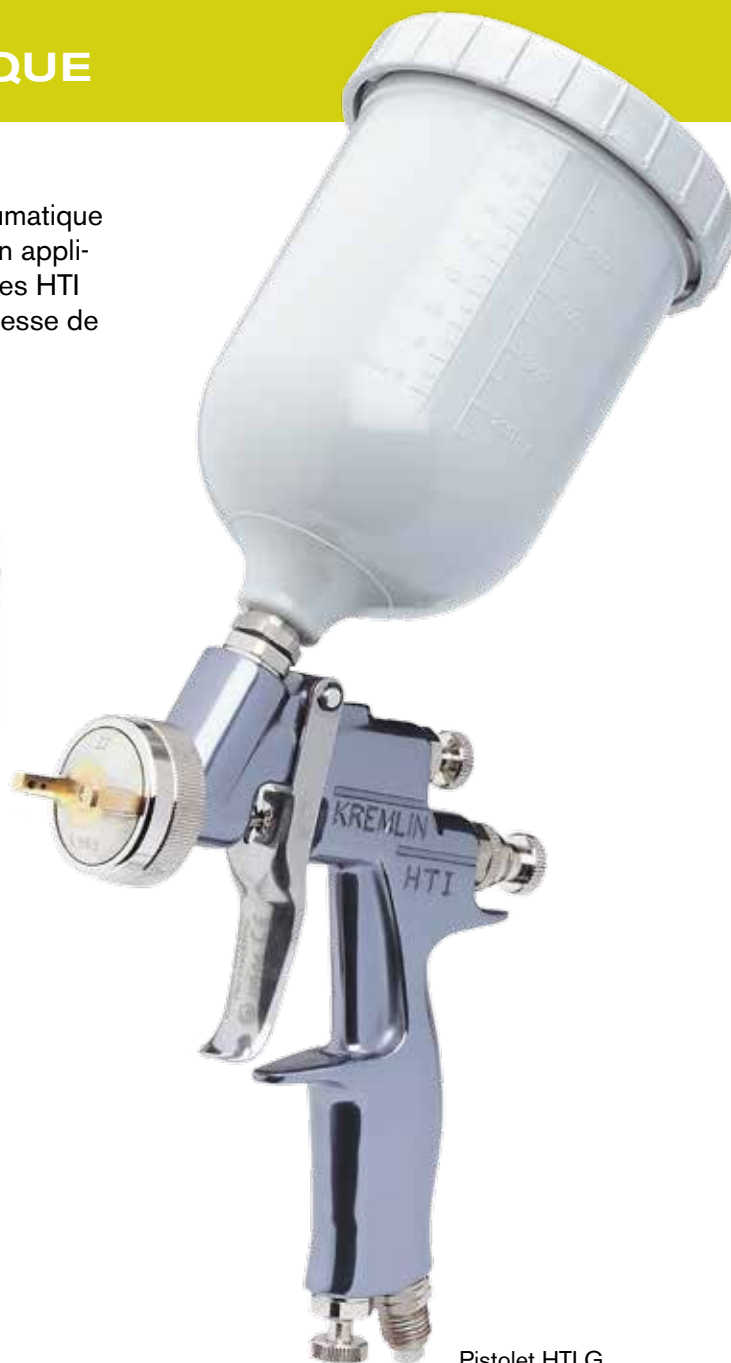
Pistolet HTI G