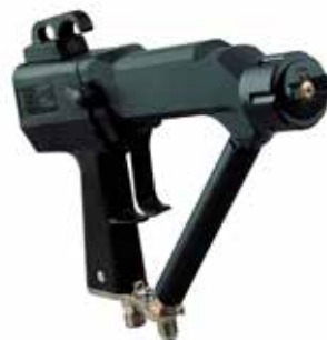
Pistolet électrostatique KMX