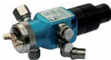
Pistolet automatique A29 HPA