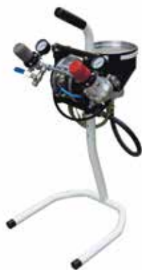
Pompe PMP 150 Pratik

Bien entendu chez Kremlin-Rexson la technologie pneumatique basse pression est toujours présente et développée. En application manuelle ou automatisé, les pistolets des gammes HTI et HPA surclassent toute compétition en matière de finesse de pulvérisation et conception avancée.