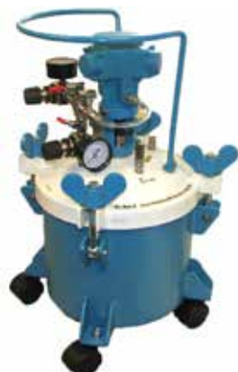
Vase pression avec agitateur