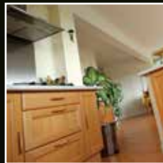
Cuisine / Salle de bain