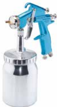
Pistolet HPA A